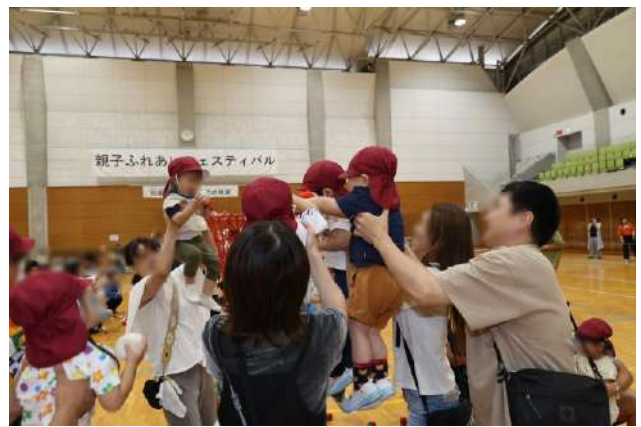
親子ふれあいフェスティバル